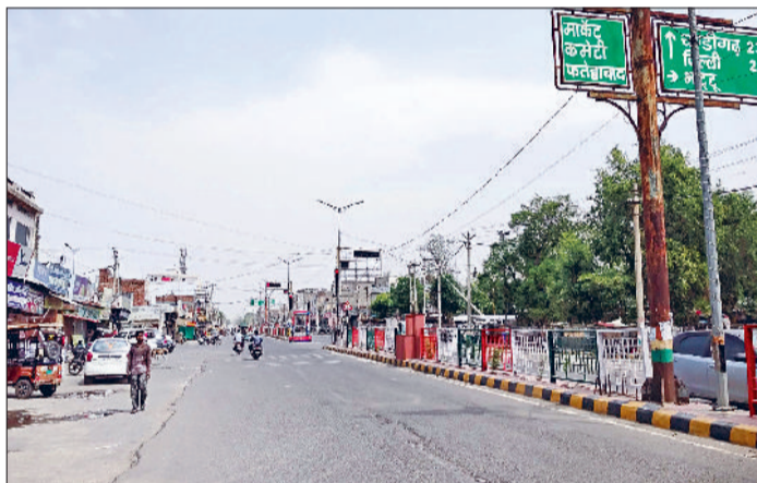
फतेहाबाद। शहर में सुबह के समय छाये बादल।

पिछले तीन दिनों से मौसम ने करवट तो ली लेकिन गर्मी और उमस बरकरार है। हालांकि लू से राहत मिली है लेकिन पसीने ने लोगों की परेशानियों को बढ़ा दिया है। बुधवार को आसमान में दिनभर बादल छाए रहे लेकिन बारिश नहीं होने से उमस ने लोग को बेहाल रखा। दिनभर गर्म हवाओं और पसीने से लोग परेशान नजर आए। मौसम विभाग के अनुसार बुधवार रात से बारिश होने की संभावना है, जबकि वीरवार को भी वर्षा के आसार बने हुए हैं। मंगलवार को क्षेत्र में हल्की बारिश दर्ज की गई थी, जिससे नमी की मात्रा बढ़कर 83 फीसदी दर्ज की गई जोकि इस सीजन में सबसे ज्यादा है। यही वजह है कि लोग पसीने से भी तर-बतर हो रहे हैं। नमी के कारण बुधवार को पूरे दिन उमस भरी गर्मी ने शहरवासियों को बेहाल कर