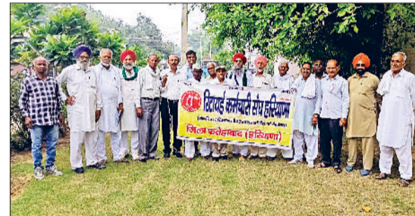
फतेहाबाद। बैठक में भाग लेते रिटायर्ड कर्मचारी संघ के पदाधिकारी।