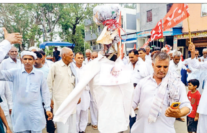
भट्टकलां। प्रदर्शन कर पुतला फूंकते किसान व प्रदर्शन के बाद अधिकारी को ज्ञापन सौंपते किसान सभा के पदाधिकारी।